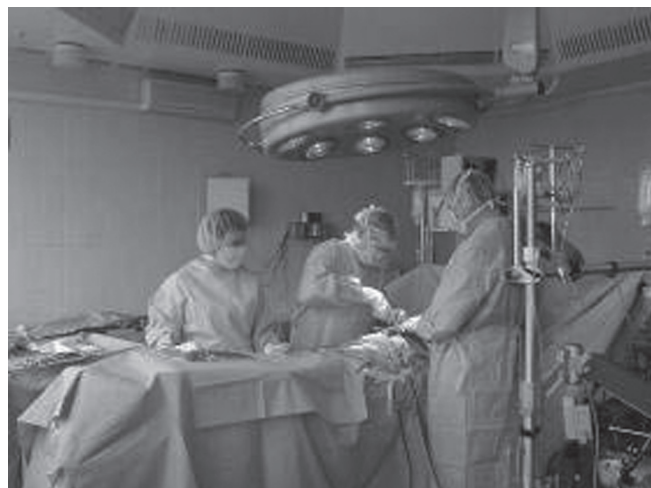
Secvențe din sala de operații

Experiența IMSP Centrul de Chirurgie a Inimii este recunoscută atât pe plan național, cât și internațional. Pe parcursul