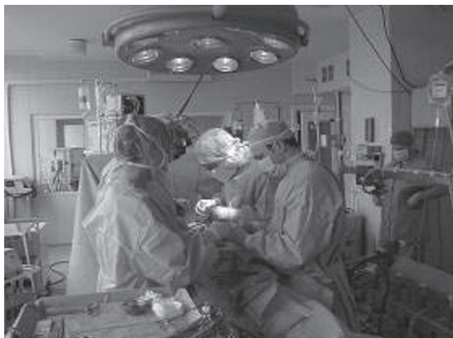
Secvențe din sala de operații

Activitatea științifică în domeniu a început în a. 1991, odată cu formarea Laboratorului științific de cardiochirurgie în cadrul Institutului de Cardiologie.