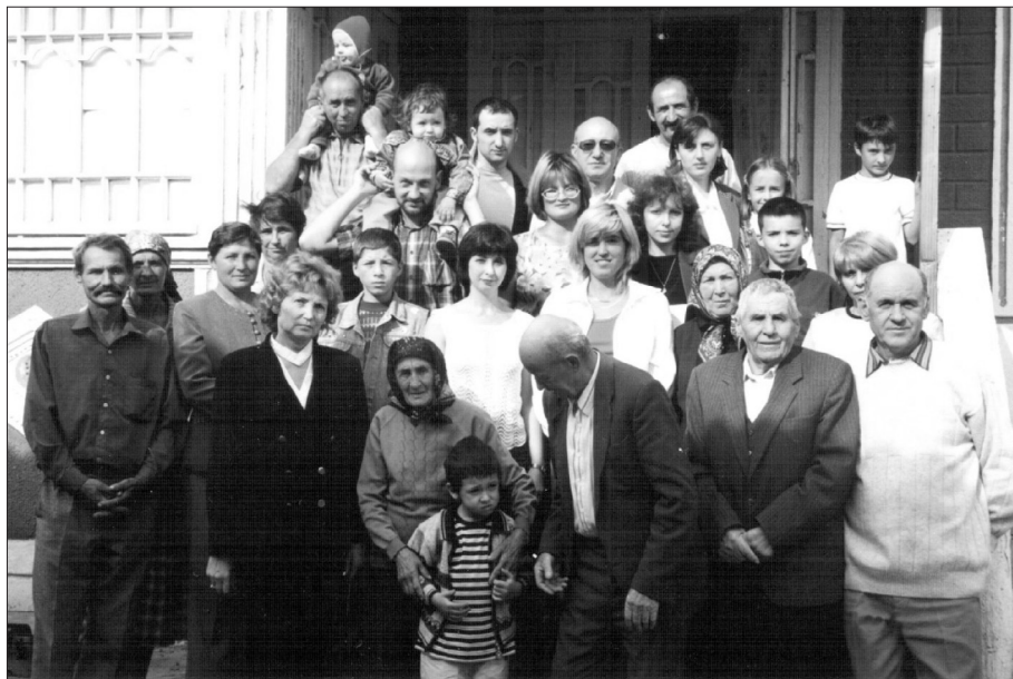
Neamul Parii la un început mileniului III