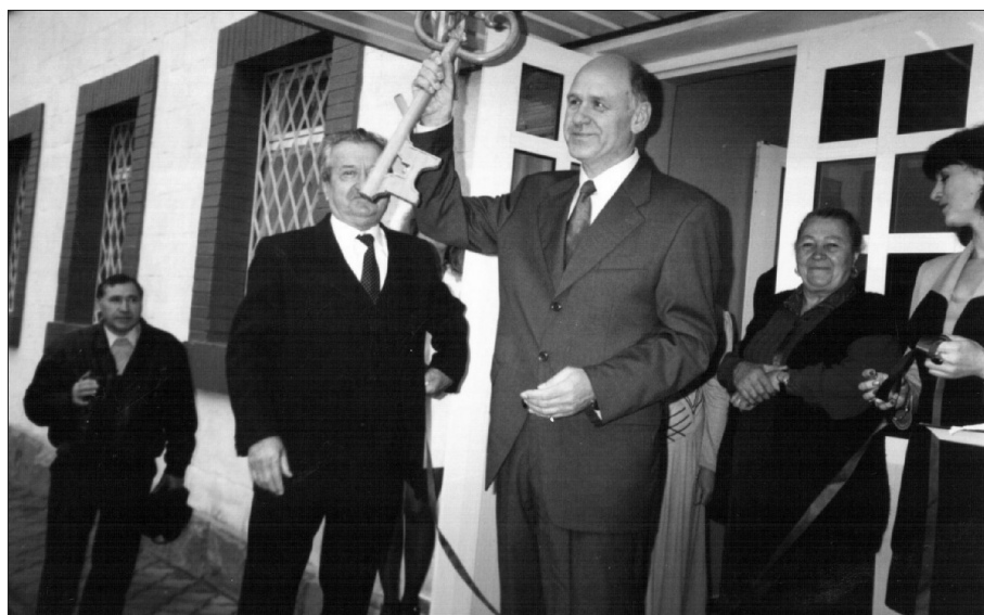
Boris Parii la inaugurarea Institutului National de Farmacie