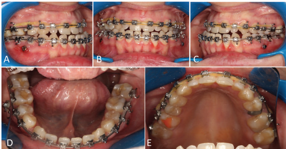
Fig.1. Aspect fotografic intraoral al pacientei R.O.,32 ani. A. Lateral dreapta. B.Din normă frontală. C. Lateral stânga. D. Arcada inferioară. E. Arcada superioară.