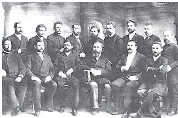
Foto 18. Sclifosovschi în compania colegilor și discipolilor (foto)

Vizitând cu această ocazie clinica lui Sclifosovschi, Virchow a declarat într-un interviu: „Sclifosovschi este șeful instituției invidiate de alte popoare ale Europei!“ [9]