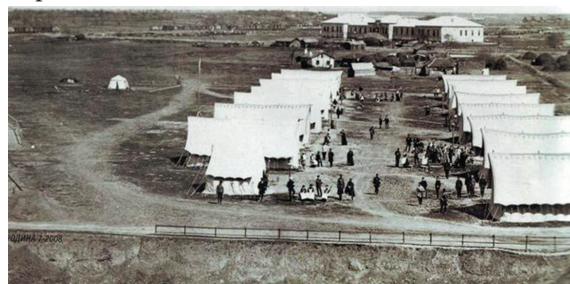
Foto 5. Spital militar de campanie rusească de triere și amplasare a răniților în perioada războiului ruso-turc 1877—1878. România

A fost implicat în calitate de chirurg șef al armatei ruse în războiul ruso-turc (aa.1877—1878), izbucnit după revoltele din Balcani [2,5,8].