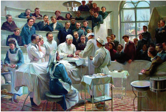
Foto 13. Lecții, prezentate în sala de operații

A fost ales de două ori decan al Facultății de Medicină al Alma Mater .