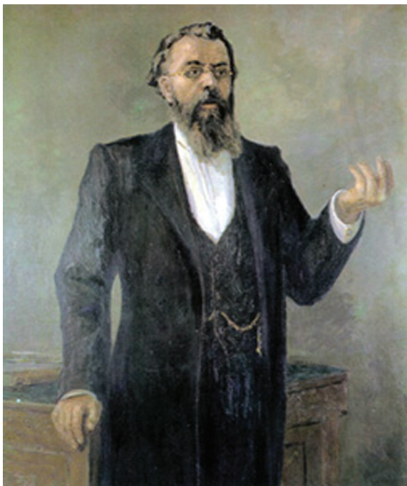
Foto 17. Portretul Profesorului Nicolai Sclifosovschi, făcut la prezentarea unei prelegeri din cursul de chirurgie de facultate pentru medici cursiști ai Institutului Clinic Imperial al Marii Ducese Elena Pavlovna din Sanct-Petersburg, a.1896.

Autoritatea lui Sclifosovschi în lumea medicală de atunci a devenit într-adevăr incontestabilă [2].