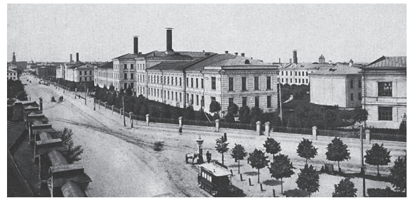
Foto 15. Campusul clinic din Девичье Поле, Moscova

În ritm rapid în vecinătatea clinicii medicale din Девичье поле a fost construit un adevărat orașel, iarăși — cu participarea și sub supravegherea directă, activă a lui Nicolai Scelifosovschi [9].