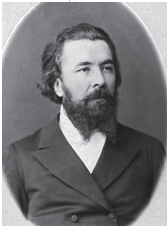
Foto 12. Profesorul Nicolai Sclifosovschi, decan al Facultății de Medicină a Universității Imperiale din Moscova, a.1882

S-a transferat în a.1880 la catedra clinicii chirurgicale de facultate a Facultății de Medicină a Universității Imperiale din Moscova, unde a fost ales Profesor universitar și promovată în funcția de șef, pe care a exercitat-o cu succes [3].