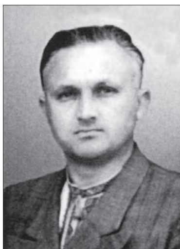
Avramenco N.M. (1950—1951)