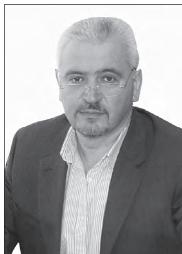
Gobjila V. Ș. (2015—prezent)