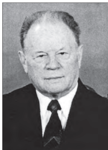
Sîtnic V.N. (1975—1986)