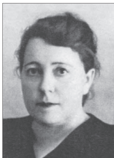
Ovcearuc O.A. (1951—1957)