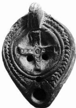
Fig. 10. Artefact creștin din acea epocă

Călăul i-a extras dinții și i-a zdrobit maxilarele. Apollonia a rezistat torturilor inumane și a refuzat să renunțe la credința sa. Văzând aceasta, păgânii au întins după oraș un foc mare și au amenințat să o ardă de vie pe stâlp, dacă ea nu va ridica rugi către idoli. Femeia curajoasă a ales să se arunce în foc, decât să îndeplinească cerințele gloatei furioase de a-și trăda crezul.