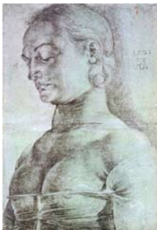
Fig. 3. Apollonia tânără (Albrecht Durer, 1521)