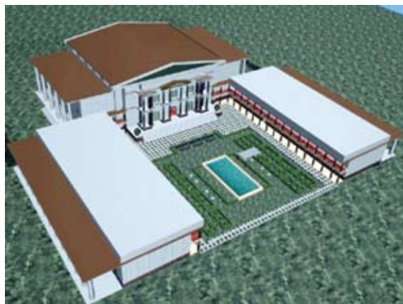
Fig. 4. Museyon din Alexandria

logică, o grădină botanică și o faimoasă bibliotecă, care a fost cel mai valoros tezaur cultural al lumii aproape nouă secole.