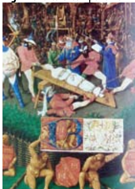
Fig. 11. Torturarea Apolloniei Fig. 12. Arderea pe rug a Apolloniei

Călăul i-a extras dinții și i-a zdrobit maxilarele. Apollonia a rezistat torturilor inumane și a refuzat să renunțe la credința sa. Văzând aceasta, păgânii au întins după oraș un foc mare și au amenințat să o ardă de vie pe stâlp, dacă ea nu va ridica rugi către idoli. Femeia curajoasă a ales să se arunce în foc, decât să îndeplinească cerințele gloatei furioase de a-și trăda crezul.