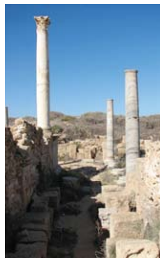
Fig. 5. Ruinele templului Serapis

Strict vorbind, au existat două biblioteci: cea laică din Bruhiyon și cea religioasă din templul Serapis. Aceste posibilități au oferit tinerei talentate condiții unicate pentru formarea calităților de predicator remarcabil și polemist imbatabil.