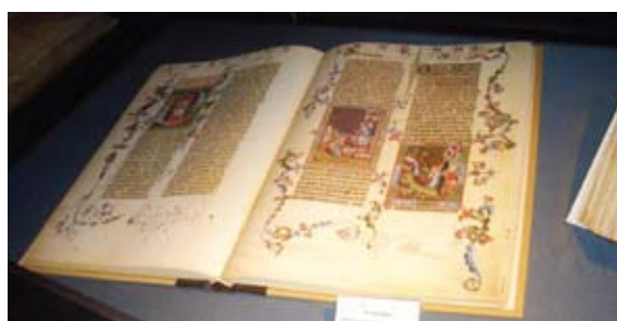
Fig. 8. Carte a Bibliotecii din Alexandria