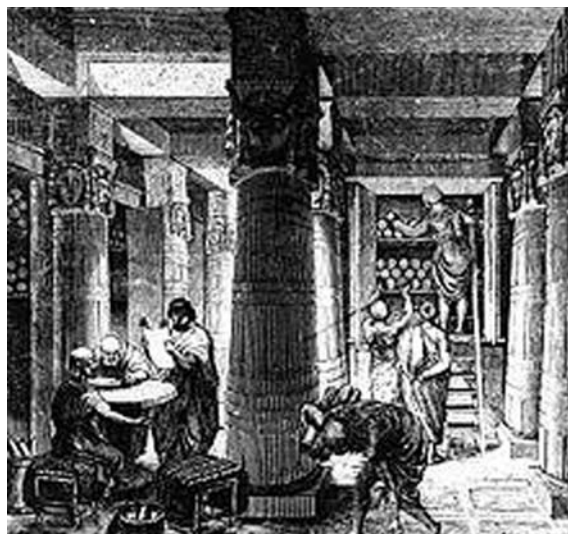
Fig. 6,7. Biblioteca din Alexandria