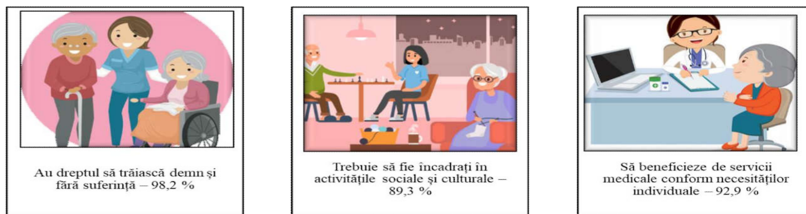
FIG. 2. Atitudini pozitive ale medicilor neurologi