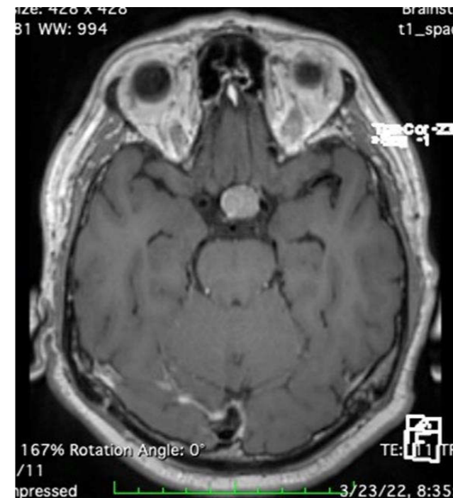
Fig.1 IRM Adenom hipofizar trans

Cuvinte-cheie. Cefalee unilaterală. SUNCT. Adenom hipofizar.