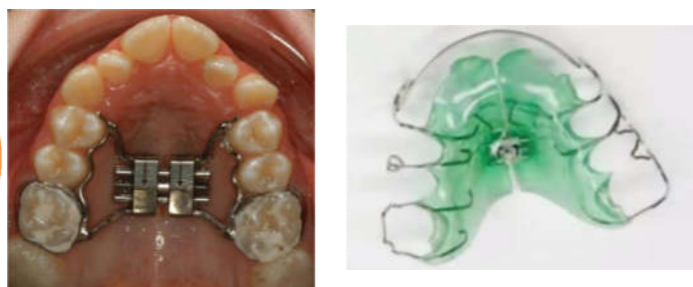
Figura 1. Aparat fix și aparat mobilizabil pentru expansiunea maxilarului superior.

Anomaliile dento-maxilare sunt rezultatul interacțiunii complexe a multitudinii de factori locali și generali, cauze ereditare, tulburări de dezvoltare sau malocluzii dobândite. Dizarmonia dento-alveolară cu înghesuire este un sindrom ortodontic provocat de lipsa unei asociații perfecte între dimensiunile dinților, perimetrul arcadei dentare și dimensiunile oaselor maxilare, care tinde spre prezența unui volum mărit al dinților aranjați pe arcade dentare deformate.