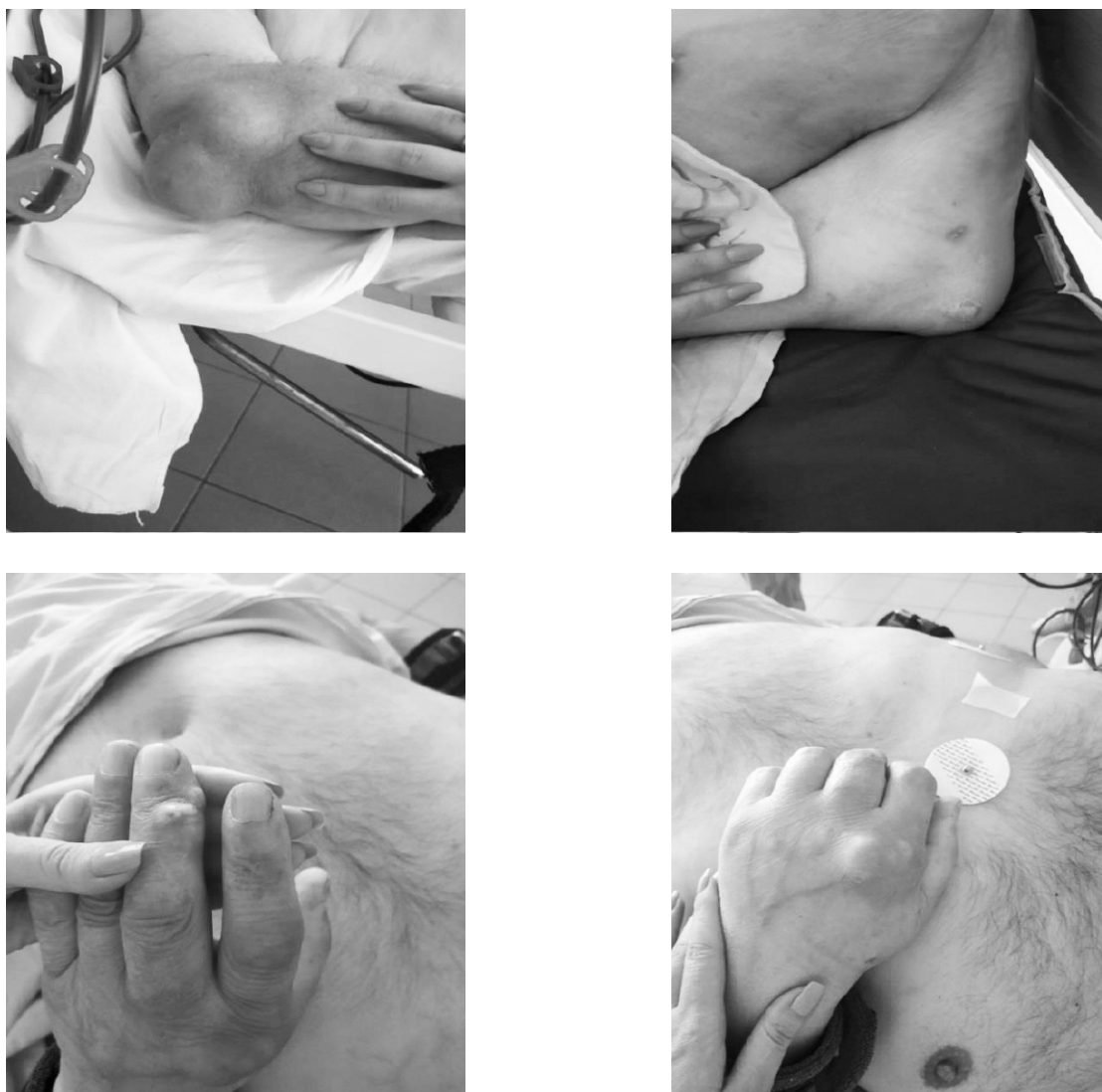
Fig. 3 Tofi multipli de dimensiuni de la 3 cm până la 10 cm în jurul articulațiilor afectate.

Fig. 3 Multiple typical tophi of various sizes, from 3 to 10 cm.