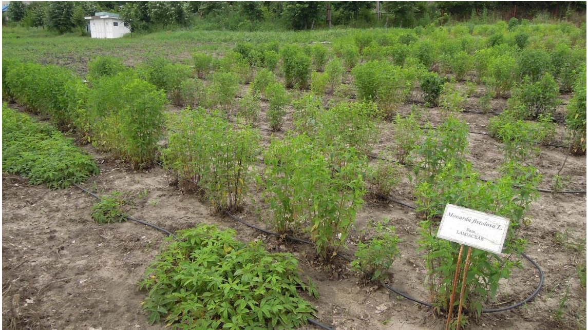
Plantație de Monarda 2021, anul II