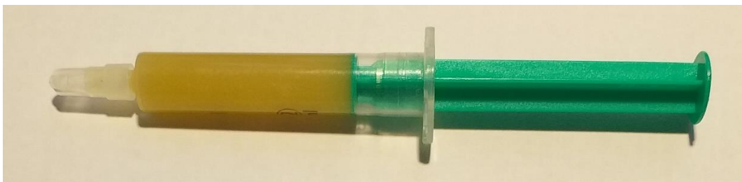
Monarda, pastă stomatologică adezivă