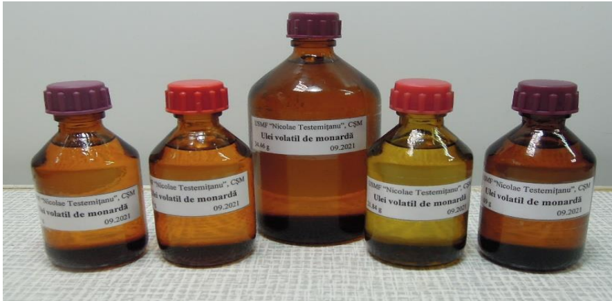
Uleiuri volatile de Monarda

Au fost obținute 4 forme farmaceutice cu ulei volatil de monardă pentru tratamentul bolilor gingivale și parodontale: „Monardă, picături bucofaringiene fără alcool”, „Monardă, gel gingival”, „Monardă, unguent stomatologic”, „Monardă, pastă stomatologică adezivă”.