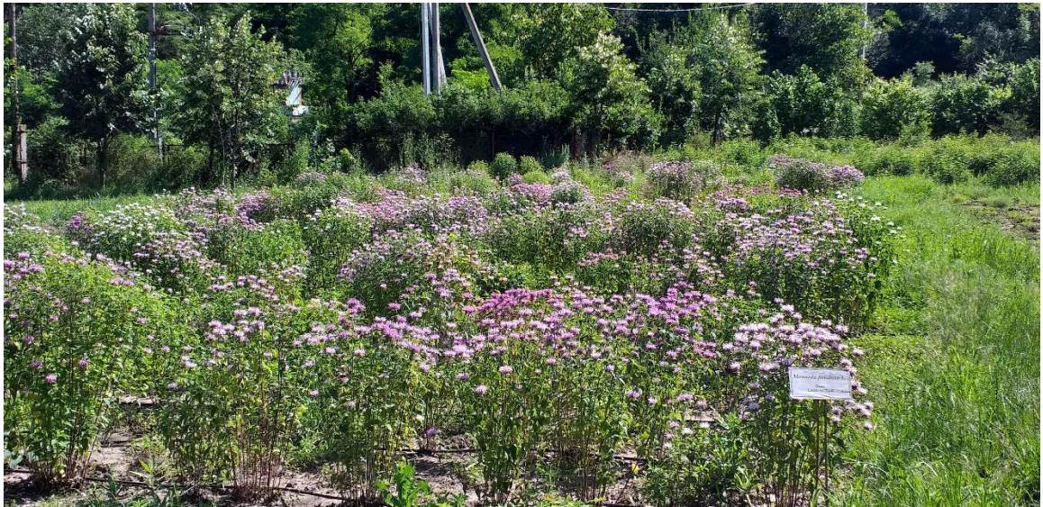
Plantație de Monarda, 2021, anul II