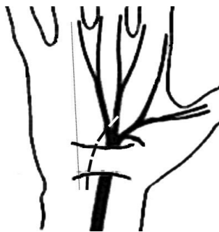
Figura 2. Schema inciziei

La toți acești pacienți au fost folosite două metode de anestezie: locală – la 3 (9%) bolnavi, tronculară – la 32 (91%) bolnavi.