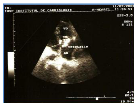
Imaginea 2. Ecocardiografia Pacient T., 32 ani. Vegetații mari pe valva tricuspida

4. EKG. Ritm sinusal cu frecvența contracțiilor cardiace - 94 bătăi pe minut, AEC verticală, bloc incomplet de ram drept a f.His .