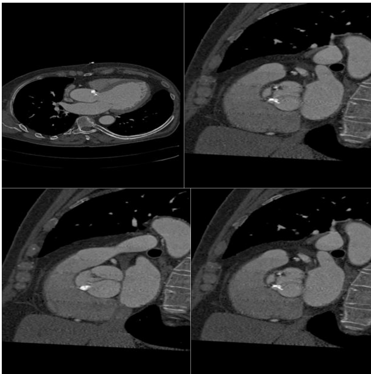
Рис. 3. Компьютерная томография пациента X с кальцификацией аортального клапана.

КТ при кальцинозе клапанных структур сердца позволяет подробнее оценить морфологическую структуру кальцификатов, изучить степень тяжести поражения клапанов сердца, выявить поражения миокарда (гипертрофии, рубцы), оценить состояние полостей сердца и перикарда.