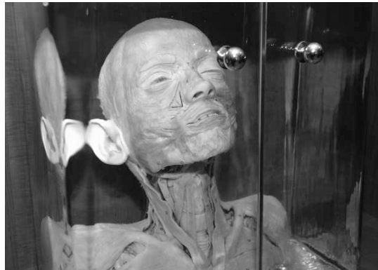
Рисунок 1 – Анатомический музей. Зал «Аппарат движения» (слева). Рисунок 2 – Препарат с мимической мускулатурой, мышцами шеи и груди (справа)

В 2-х шкафах этого зала выставлены препараты, изготовленные студентами разных лет, в основном под руководством доц. Т.М. Титовой.