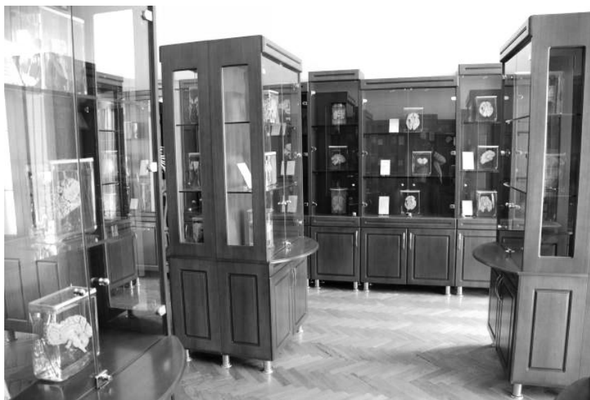
Рисунок 4 – Зал «Центральная нервная система»

Зал возрастной анатомии включает препараты детских внутренних органов, костей, суставов и др., а также многочисленные зародыши человека разных возрастов, внематочную беременность; зародыши, соединённые посредством пуповины и плаценты со стенкой матки.