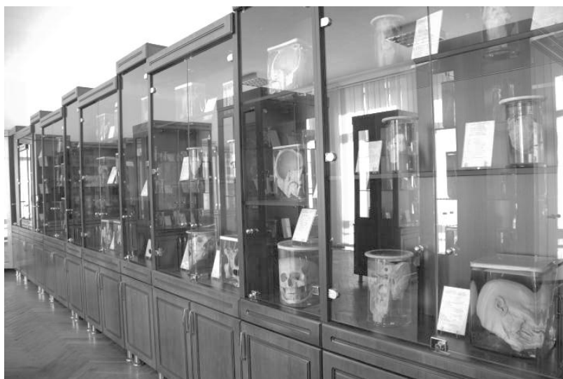
Рисунок 3 – Музей кафедры. Зал «Внутренние органы»

В этом зале экспонируется и комплекс органов, извлечённый при оперативном грыжесечении. В грыжевом мешке оказались половые органы гермафродита.