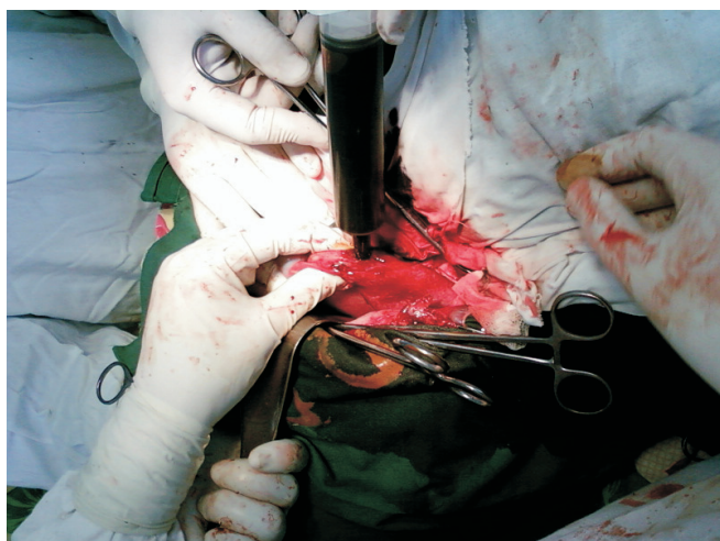
Fig. 2. Introducerea substanțelor protescolicide.

scăzute a complicațiilor. Datorită drenajului se micșorează probabilitatea apariției abceselor hepatice postoperatorii, a fistulelor biliare sau a peritonitelor biliare [5, 7, 14] (fig. 3).