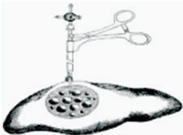
Fig. 6. Puncția-aspirația conținutului cu ajutorul acului Veress.

intrarea în cavitatea chistului, schimbă automat partea sa ascuțită pe una boantă, datorită unui resort. Astfel se micșorează absorbția membranelor chitinoase de către ac, prevenindu-se trauma ficatului în timpul manipulărilor de aspirație-irigație [5, 7, 11, 14]. Realizând această metodă se obțin un șir de avantaje, care duc la reducerea complicațiilor. Astfel la introducerea pneumoperitoneului presiunea intrachistică este mai mică sau egală cu presiunea intraabdominală. Aspirarea conținutului cu ajutorul unui ac laparoscopic, introdus printr-o canulă vidată sau lipirea acesteia cu fibrină de pereții chistului, previne revărsarea conținutului chistului în cavitatea abdominală. În același timp metoda nu poate fi aplicată în cazul chisturilor supurate, calcificate sau cele multiple [1, 2, 3] (fig. 6).