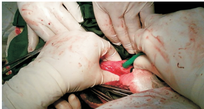
Fig. 1. Punctia și aspiratia conținutului chistului.