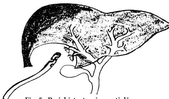
Fig. 5. Perichistectomie parțială.

plon în cavitatea restante și fixarea ei pe perichistul restant, diminuând astfel diametrul cavității restante (fig. 4).