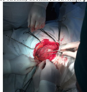
Fig. 1. Laparotomie mediană, mobilizarea chistului hidatic calcificat

După realizarea unei pregătiri preoperatorii cu soluții perfuzabile și aminoacizi, pe 27.X.2016 se intervine chirurgical prin laparotomie mediană superioară finisată prin echinococctomie ideală, drenarea cavității peritoneale.