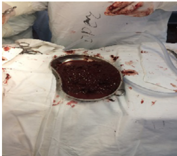
Fig. 3 Conținutul din cavitatea chistului

Perioada postoperatorie este satisfăcătoare. Pe 4.XI.2016 este externată la supravegherea medicului de familie și chirurgul.