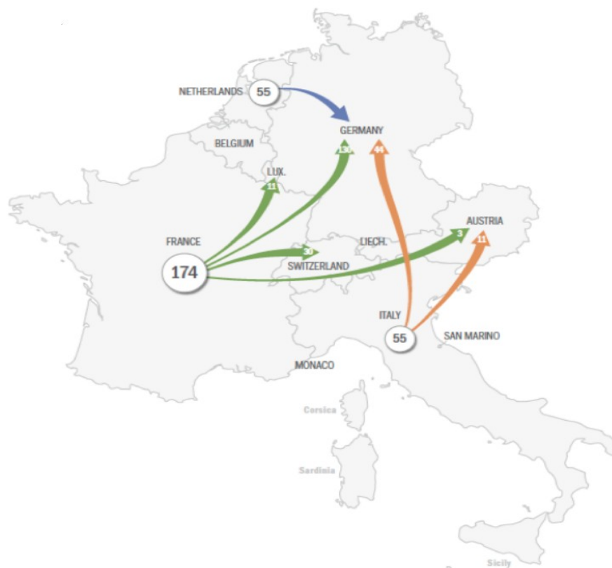
Fig. 1 Transferul transfrontalier a 300 de pacienți europeni cu COVID-19 [41].

In the majority of cases, the cross-border transfer of patients was initiated following the interaction between the high government structures. The European solidarity is a result of various initiatives at different levels. Thus, the president of the General Department Council of Haut-Rhin from France has requested help from Germany. The Dutch Minister of Health appealed to his peer in Westphalia in northwestern Germany, as the country was facing a scenario in which its ICU capacity would be overloaded.