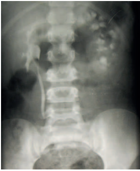
Figura 1. Urografie intravenoasă – pe stânga megacalicoză.

Altă afecțiune cu care trebuie să facem diagnostic diferențial este megapolicalicoză – o afecțiune congenitală caracteristică prin dilatarea calicelor și creșterea numărului lor până la 20, uneori și mai mult. Bazinetele și ureterele nu sunt modificate. Parametrii funcționali și funcția excretorie a rinichiului este păstrată, fapt ce se confirmă la urografie intravenoasă (întârziată) (Figura 1, 2), ecografie diuretică și/sau scintigrafie în dinamică. Copiii cu megacalicoză nu necesită tratament chirurgical.