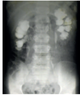
Figura 2. Urografie intravenoasă. Urolitiază bilaterală, concremente în ambele bazinete, hidrocalicoză. Bazinetele nu sunt dilatate.

Dacă la ecografie s-a depistat pieloectazie, este necesar de a stabili cauza și nivelul obstrucției. În dilatarea cavităților renale, fără modificarea ureterelor, se presupune obstrucția la nivelul segmentului pielo-ureteral.