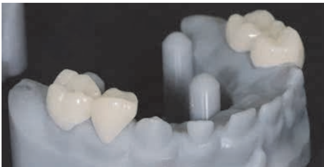
Figura 5. Coroanele acrilice pe model

Protocolul terapeutic a inclus igienizarea profesională, realizarea fotoprotocolului și scanare intraorală 3D. Modelele digitale au fost procesate și transmise laboratorului de tehnică dentară. Relațiile intermaxilare au fost stabilite în articulatur virtual, iar coroanele au fost proiectate în software-ul Exocad și ulterior cimentate în cavitatea orală.