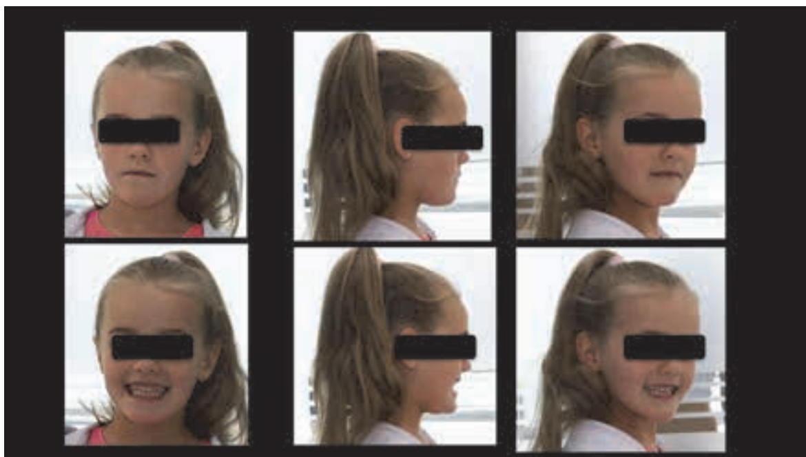
Figura 7. Aspectul facial al pacientului imediat după fixare

Pacienta și părinții au fost instruiți privind menținerea unei igiene orale corespunzătoare și monitorizați la intervale de fiecare două luni.