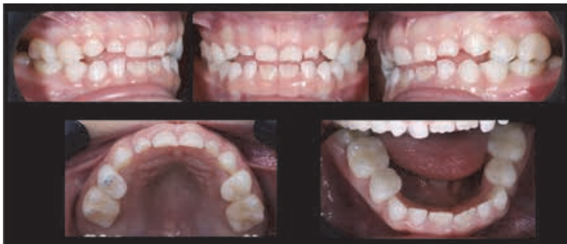
Figura 6. Poze intraorale imediat după fixarea coronițelor

Imediat după cimentare, s-a observat dezocluzia dentară cu obținerea unei inocluzii verticale de aproximativ 4 mm și a unei relații molare de clasa I. Astfel, au fost create condițiile necesare pentru realizarea „saltului ocluzal” și pentru re poziționarea mandibulei posterior și superior.