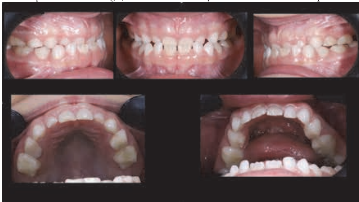
Figura 2. Poze intraorale a pacientului

Examinarea intraorală a evidențiat dentiție mixtă timpurie, uzura incisivilor temporari, incisivii centrali inferiori parțial erupți, precum și prezența primilor molari permanenți superiori și inferiori. Relația molară bilaterală corespundea clasei III Angle, fiind asociată cu o mușcătură inversă anterioară de aproximativ 2 mm.