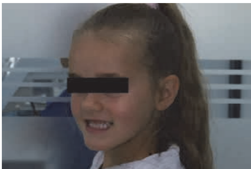
Figura 1. Aspectul extraoral al pacientului

Examinarea extraorală a evidențiat micșorarea treimii inferioare a feței, tensiune la închiderea buzelor și aspect facial ușor încordat. S-a constatat o divergență facială anterioară și profil ușor concav. Unghiul nazo-labial era drept spre obtuz. Zâmbetul avea un caracter neestetic, dinții superiori fiind puțin vizibili, iar cei inferiori mai expuși.