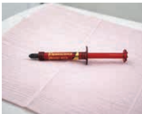
Fig. 10. Sistem de albire profesională Opalescence Boost 40%