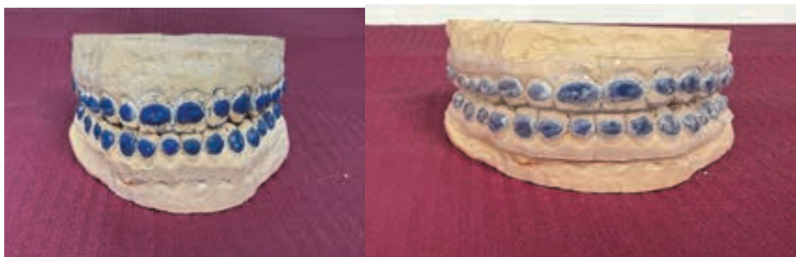
Fig. 15. Modelele de lucru