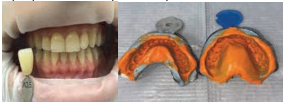
Fig. 13. Nuanța inițială a dinților A 3,5 Fig. 14. Realizarea amprentelor

Inițial, s-a efectuat un control al stării suprafețelor dentare, cu evaluarea prezenței depunerilor moi și tari, apoi a fost urmat de igienizarea profesională a cavității bucale înainte de realizarea albirii dentare la domiciliu cu gelul Opalescence PF concentrația de 15 %. Ulterior am stabilit culoarea inițială a dinților care în cazul pacientei a fost A3,5 (figura 13). Pentru procedura de albire s-a ales metoda la domiciliu, utilizând gutiere individualizate, confecționate pe baza amprentelor care au fost realizate (figura 14). După confecționarea gutierelor a urmat proba pe modele (figura 15), apoi proba și adaptarea acestora în cavitatea bucală (figura 16), urmată de aplicarea gelului Opalescence PF cu concentrația de 15% în gutiere pe suprafețele vestibulare ale dinților. Gutierele au fost purtate zilnic, timp de 4-6 ore, pe o perioadă de 10 zile. Prima aplicare a fost efectuată sub supraveghere în cabinetul stomatologic, pentru explicarea corectă a tehnicii și a recomandărilor de utilizare, iar procedura a fost continuată ulterior la domiciliu. După această perioadă, s-a obținut nuanța dinților A2 (figura 20). La finalul tratamentului de albire dentară, s-a aplicat gelul desensibilizant UltraEZ (figura 21), pe bază de nitrat de potasiu 3% și fluorură de sodiu 0,25% (NaF neutru), timp 30 de minute pe zi până la remiterea simptomelor de hipersensibilitate dentinară.