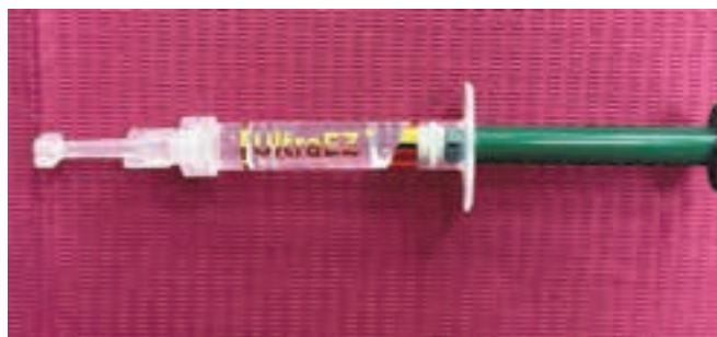
Fig. 21 Gelul desensibilizant UltraEZ