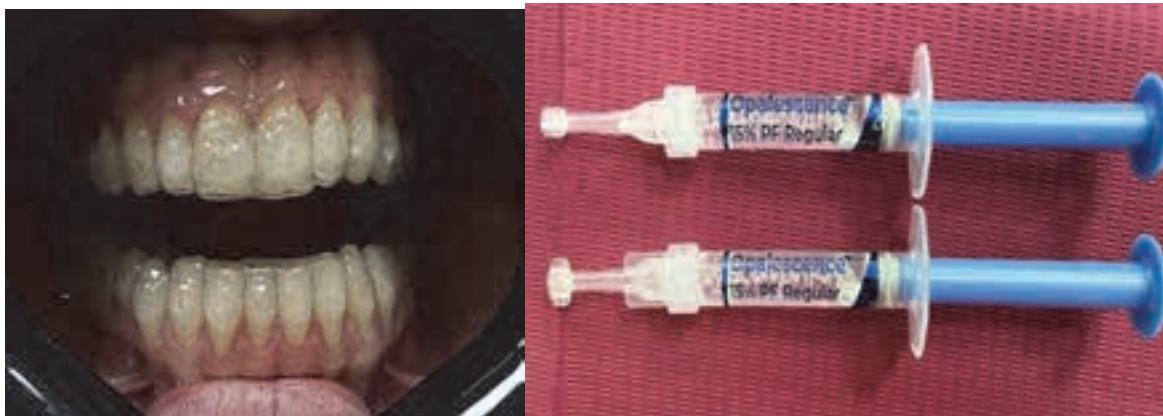
Fig. 17. Proba gutierelor în cavitatea bucală Fig. 18. Gelul Opalescence PF concentrația 15%