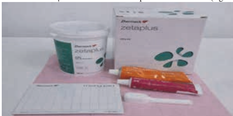
Fig. 1. Material de amprentare pe bază de silicon de condensare ( Zetaplus , Zhermack).

Pentru obținerea amprentelor arcadelor dentare în vederea confecționării gutierelor individualizate s-a utilizat materialul Zetaplus (Zhermack, Italia), silicon de condensare cu consistență crescută. Materialul prezintă stabilitate dimensională bună și fidelitate ridicată în redarea detaliilor morfologice dentare. Pentru captarea detaliilor fine a fost utilizat și materialul fluid corespunzător sistemului (figura 1).