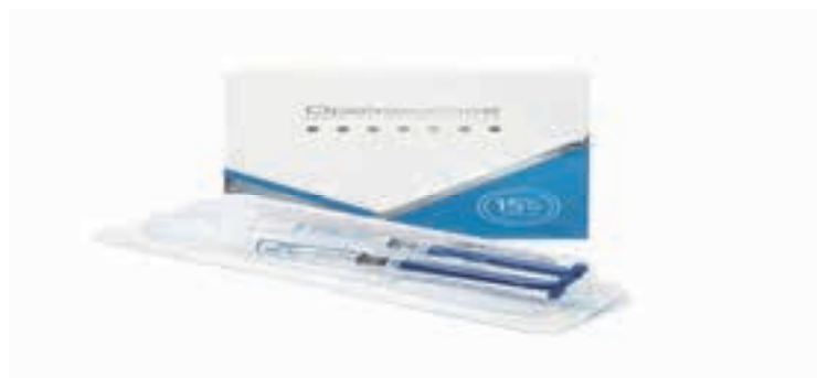
Fig. 3. Gelul pentru albirea dinților la domiciliu-Opalescence PF [10].

amorf (ACP), component cu rol în susținerea proceselor de remineralizare a smalțului. Prezența ACP contribuie la menținerea microdurității structurilor dentare și la reducerea sensibilității asociate tratamentului de albire.