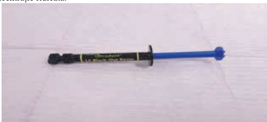
Fig. 4. Cofferdam lichid fotopolimerizabil Ultradent.

În cadrul procedurii de albire profesională, etapa inițială a constat în izolarea câmpului operator prin aplicarea unui cofferdam lichid fotopolimerizabil LC Block-Out Resin (Ultradent, SUA) (figura 4). Materialul a fost aplicat la nivelul coletelor dentare și al marginii gingivale, apoi fotopolimerizat, formând o barieră protectoare elastică și aderentă. Această etapă a asigurat protecția țesuturilor moi împotriva acțiunii agentului oxidant utilizat în concentrație ridicată.