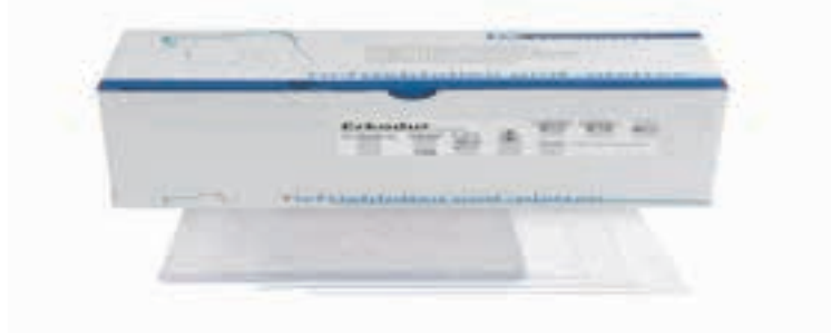
Fig. 2. Folie termoformabilă Erkodur 0,8mm pentru confecționarea gutierelor [7].

Gutiera individualizată a fost confecționată din folie termoformabilă Erkodur 0,8 mm (Erkodent, Germania). Materialul este un polimer termoplastic pe bază de PET-G (polietilen-tereftalat modificat cu glicol), care devine maleabil prin încălzire și permite adaptarea precisă pe modelul de lucru. După răcire, își menține stabilitatea dimensională și asigură distribuția uniformă a gelului de albire (figura 2).