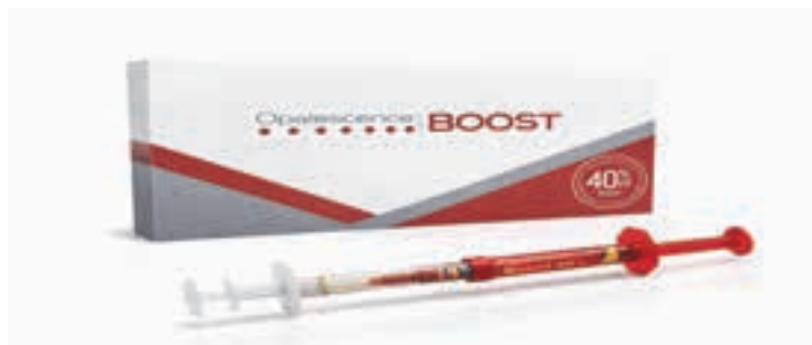
Fig. 5. Setul pentru albirea dinților în cabinet stomatologic [9].