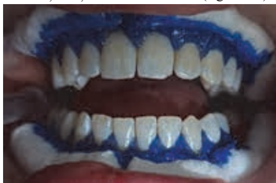
Fig. 9. Izolarea gingiei cu rulouri de vată și cofferdam