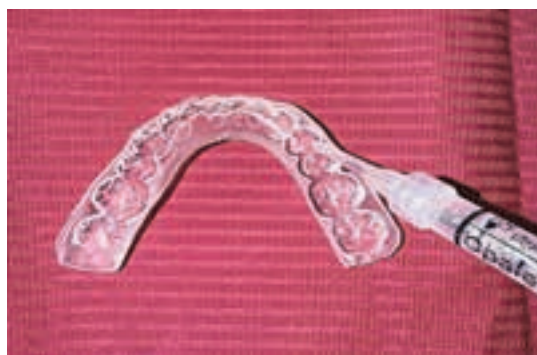
Fig. 19. Aplicarea gelului Opalescence PF 15% în zona frontală