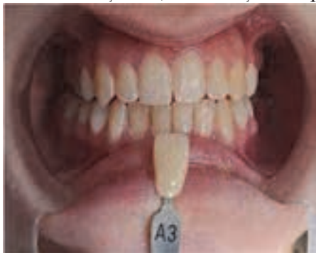
Fig. 8. Culoarea inițială-A3