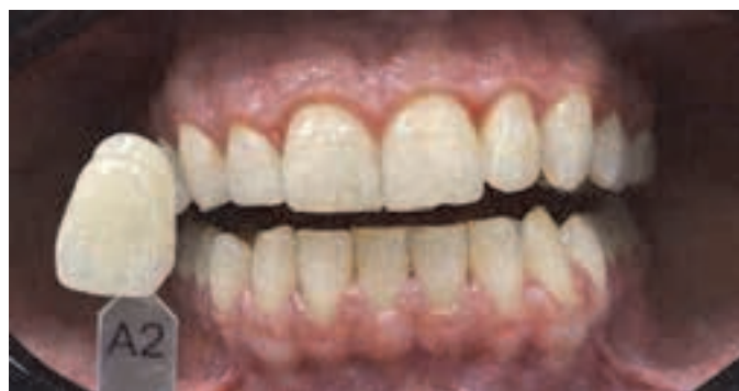
Fig. 20. Nuanța finală a dinților A2