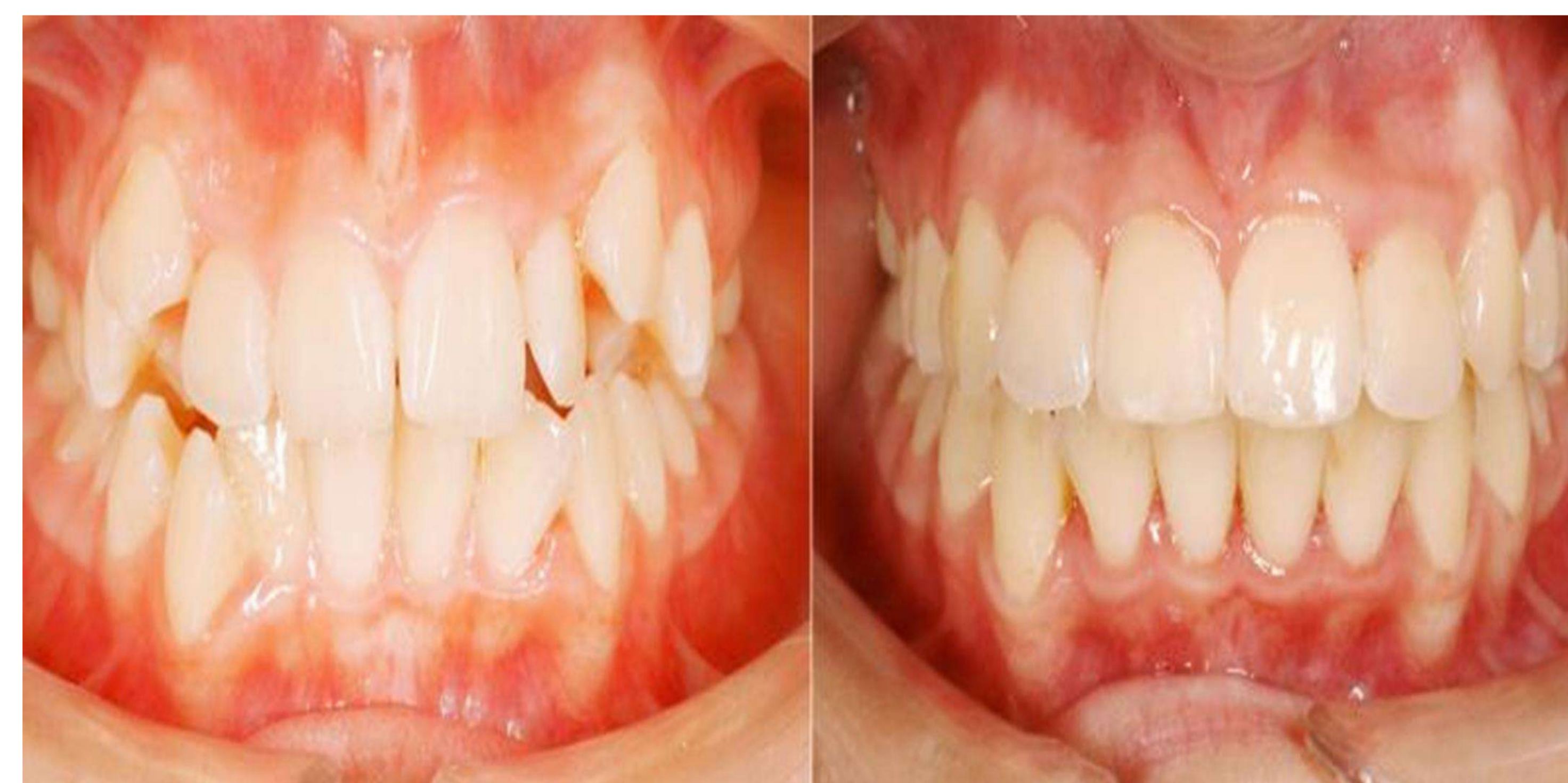
Fig.2 Dizarmonie dento-alveolară cu înghesuire pre- și post tratament

Rezultate: Obiectivele lucrării au fost îndeplinite prin analiza factorilor etiologici ce duc la apariția disarmoniei dento-alveolare cu înghesuire, studierea metodelor de diagnostic relevante, cât și prin aplicarea diverselor metode de tratament în funcție de vârsta pacientului.