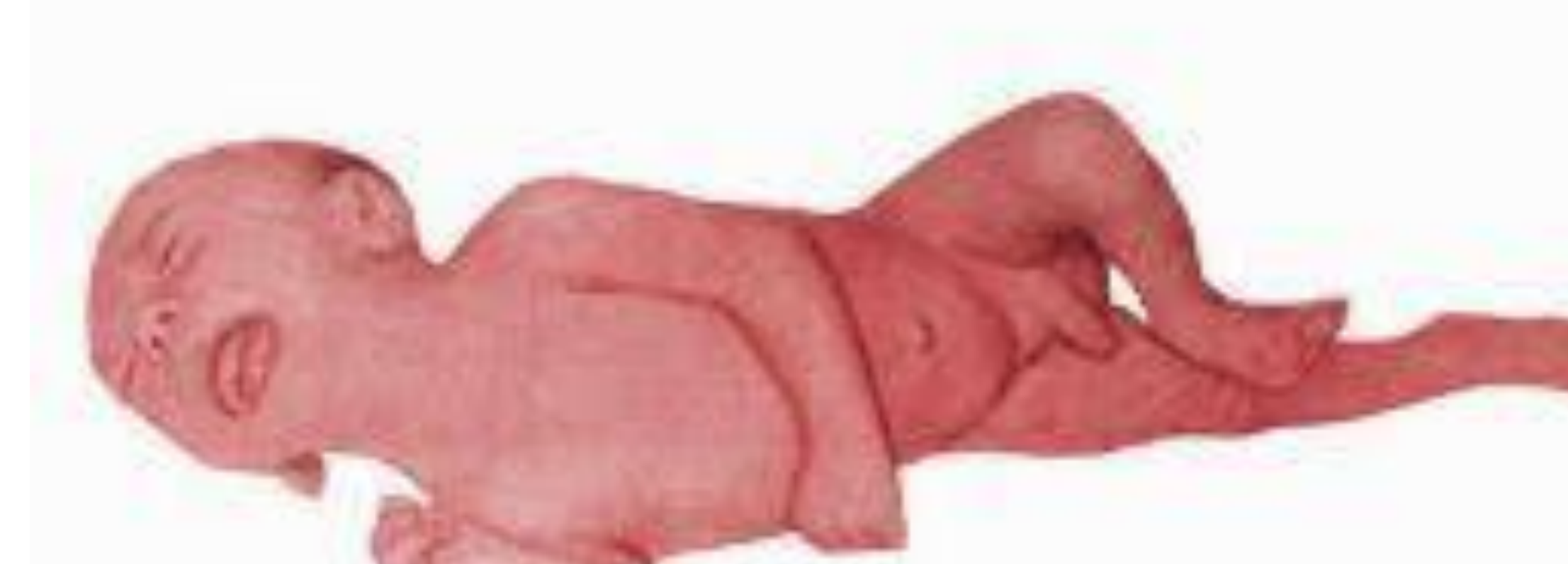
Des. 1. Semne clinice ale meningitei neonatale. Poziție forțată.

Concluzii. Meningitele neonatale reprezintă un risc înalt de mortalitate și morbiditate printre nou-născuți, determinând sechele neurologice severe. Diagnosticul timpuriu a meningitelor neonatale dar și estimarea etiologiei, sunt esențiale în ceea ce privește tratamentul precoce și prognosticul ulterior al rezultatelor neurologice la distanță.