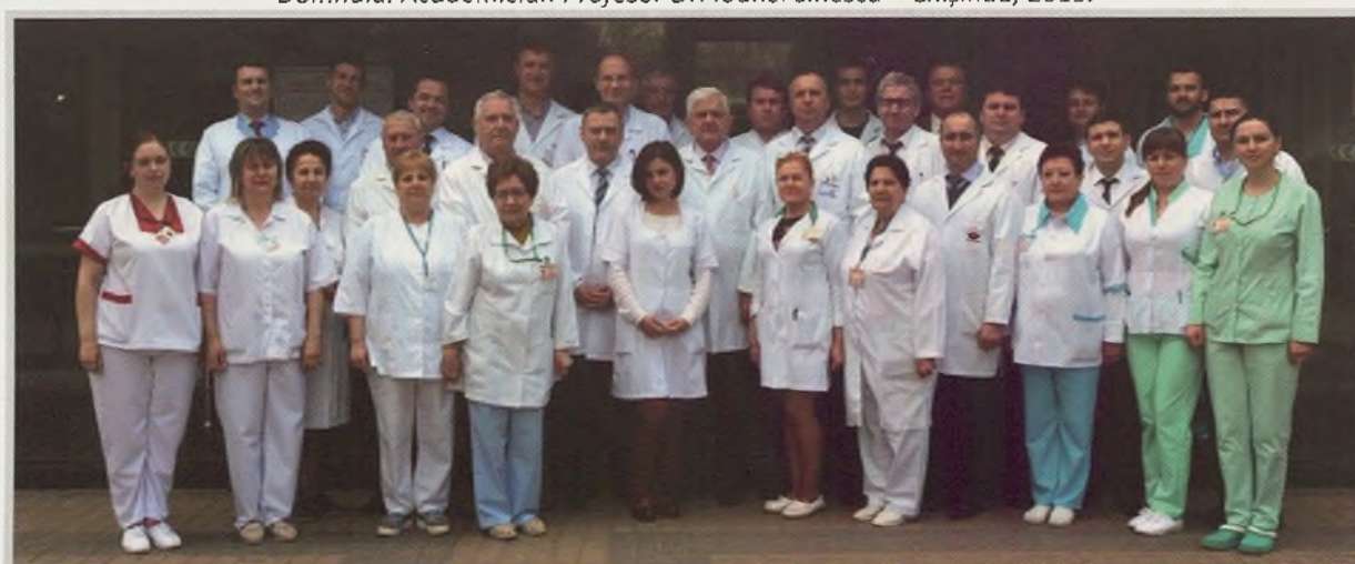
Personalul medical al Clinicii de Urologie, Dializă și Transplant Renal, Spitalul Clinic Republican. Chișinău, 2017.