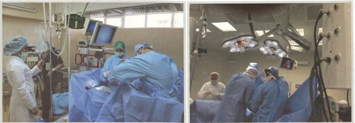
Aspecte din sălile de operații endourologice și urologice. Spitalul Clinic Republican, Chișinău, 2017.