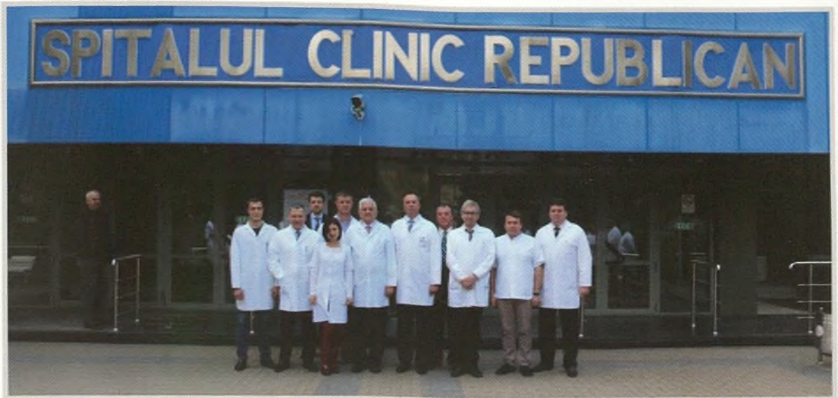
Colectivul catedrei Urologie și Nefrologie Chirurgicală, USMF "Nicolae Testemițanu". Chișinău, 2017.