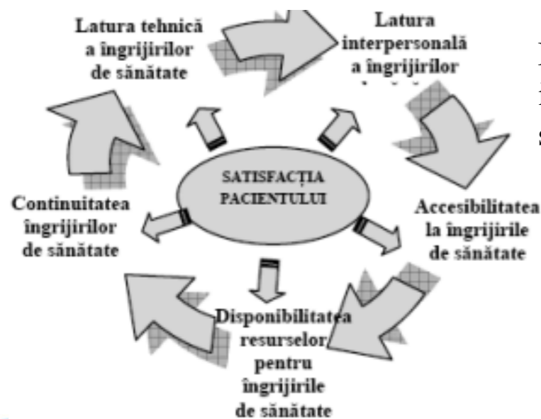
Figura 1. Elementele implicate în realizarea satisfacției pacientului

Materiale și metode. Au fost studiate 45 de surse bibliografice, articolelor științifice, teze de doctorat și efectuată o analiză a validității factorilor ce influențează eficiența serviciilor medicale. Sursele bibliografice au fost selectate în baza studiilor descriptive și analitice efectuate în perioada 2016-2021.