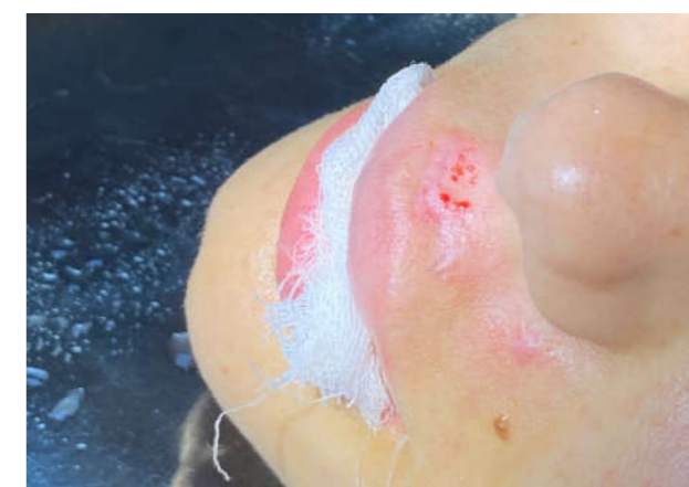
Foto 4 - pacienta 2, F/19 ani, imediat după dermabraziune, "rouă de sânge".

Concluzii. Pe baza datelor a cazurilor clinice, sa depistat că metoda de tratament a deformărilor cicatriciale trebuie selectată individual.