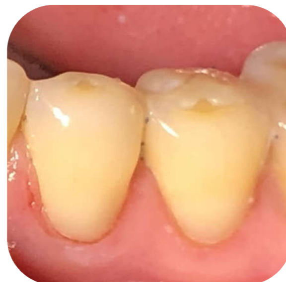
Fig. 3 Restaurările directe