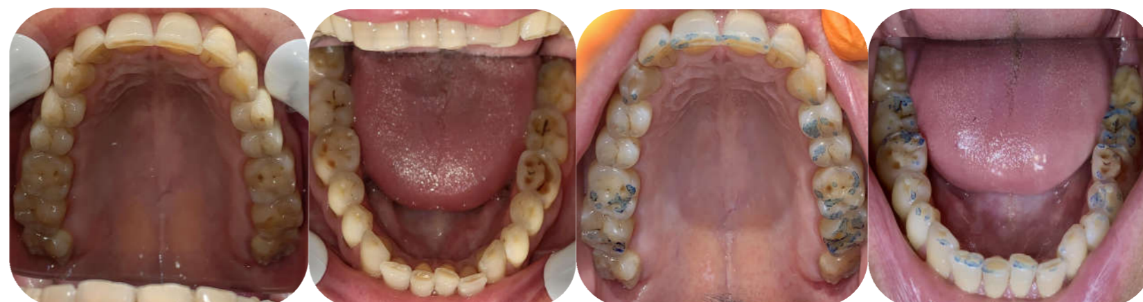
Fig.1 Arcadele dentare, proiecția ocluzală. Ocluzografia

Defectul cuneiform poate fi prezent la pacienți cu suprasolicitări ocluzale în statică și dinamică, cât și la pacienți cu bruxism. Tactica de tratament a fost una de reechilibrare ocluzală și restaurare directă.