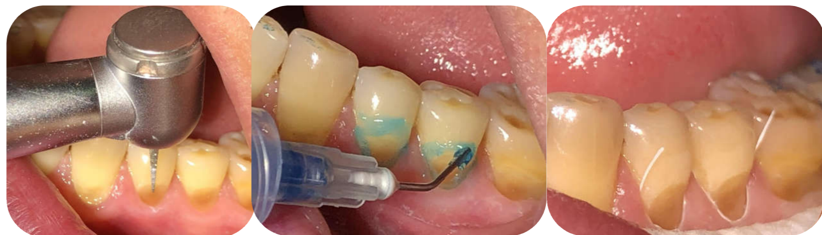
Fig. 2 Etapele restaurării directe a defectului cuneiform