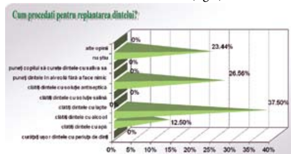
Fig.5. Cum procedați pentru replantarea dintelui?

În ceea ce privește replantarea dintelui avulsionat, un procent de 37,5% a optat pentru clătirea dintelui cu alcool, ca o primă metodă de aseptizare a acestuia, urmată de clătirea cu antiseptice și celelalte răspunsuri care trădează nevoia de informare (fig.5).