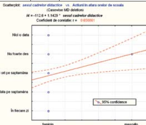
Fig.3. Corelația sexul cadrelor didactice vs. acțiunile organizate în afara orelor de școală.

În cea de a doua parte a chestionarului, cea care a conținut întrebări despre atitudine și intervenții practice a cadrelor didactice în cazul unor traumatisme a dinților temporari, la întrebarea „Dinții traumatizați sunt mai degrabă permanenți sau temporari?” în urma interpretării statistice a datelor, s-a surprins gradul de cunoaștere al anatomiei sistemului stomatognat element esențial în gradul și promptitudinea interceptării patologiei traumatice. Răspunsul de 50% în favoarea variantei „nu știu” a cadrelor didactice este îngrijorătoare, deoarece nu motivează o intervenție competentă, materializându-se într-o pledoarie certă pentru nevoia de informare în domeniul patologiei traumatice.