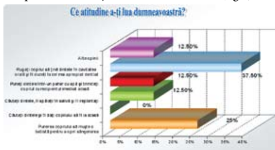
Fig.4. Atitudinea cadrelor didactice în cazul unui accident soldat cu avulsia unui incisiv superior temporar.

S-a constatat că peste 37,5% din cadrele didactice intervievate, ar interveni corespunzător în situația în care „în timpul unei ore de sport, un școlar a lovit fără intenție un băiețel de 5 ani în zona feței la nivelul gurii, iar copilul ar prezenta un incisiv superior lipsă”, iar 25% din cadrele didactice intervievate ar acționa corespunzător prevenirii accidentelor hemoragice, însă nu în mod optim privitor la situația dintelui traumatizat. (fig.4).